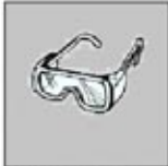
1. Kacamata Pelindung