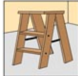
3. Jangan berdiri di atas perabotan kayu bila bersihkan ditempat yang tinggi.