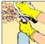
3. Penghilang noda