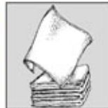
4. Kain Lap tidak berserat