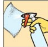
1. Semprot kaca dengan pembersih kaca, jangan berlebihan.