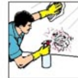
6. Gunakan pembersih dengan desinfektan pada tembok, sekat toilet, kenop pintu dan lain-lain.