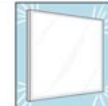
1. Tidak ada kotoran yang menempel dikaca.