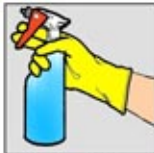
1. Pembersih Kaca