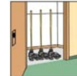
3. Bersihkan dan simpan peralatan.