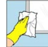
5. Bersihkan noda pada bingkai dengan kain lap.