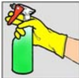
2. Pembersih Kamar Mandi