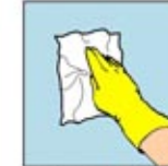
4. Lipat kain lap seperlunya untuk membersihkan permukaan yang kering.