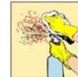
8. Periksa dan bersihkan sisa noda, laporkan bila ada area yang perlu dicat ulang atau direnovasi