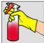
2. Chemical pembersih