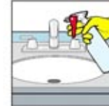
3. Semprot pembersih desinfektan di seluruh permukaan wastafel dan kran. Biarkan 3-5 menit.