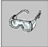
1. Kacamata Pelindung