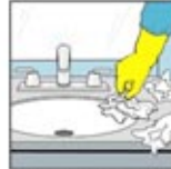
1. Ambil sampah yang masih terdapat di wastafel.