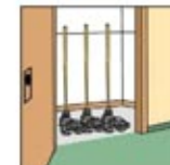
3. Bersihkan dan simpan peralatan.