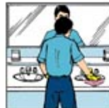
6. Lap wastafel sampai bersih dengan menggunakan kain lap yang kering dan bersih.