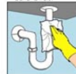
7. Semprot dan lap pipa krom yang berada dibawah wastafel.