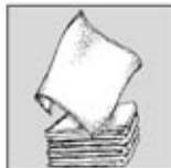
3. Kain Lap.

Memeriksa : Pastikan cleaning rugs/lap bersih cukup banyak.