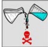
3. Jangan mencampur pembersih khusus saluran pipa dengan pembersih lain