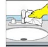
5. Bilas dan lap sampai kering, gosok keran dan pipa penyalur yang berlapis krom.