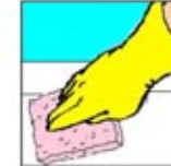
4. Gunakan spons penggosok untuk mengurangi buih sabun, kotoran dan noda.