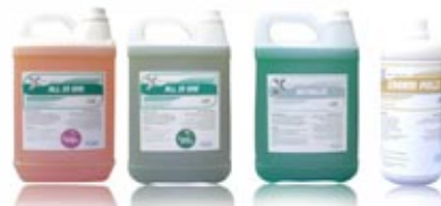
ALL IN ONE