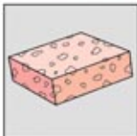
1. Spons Penggosok atau non-abrasive pad.