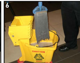
6. Bilas Kembali Pel dengan air panas di mop squeezer. Naik turunkan pel 10x