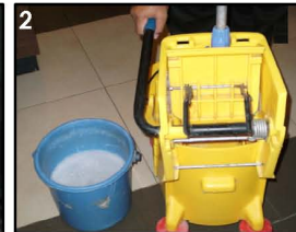
2. Peras Pel di mop squeezer. Pel tidak boleh terlalu basah.