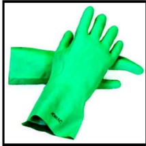
2. Sarung Tangan – Tahan Bahan Kimia