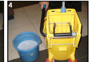
4. Peras Pel di mop squeezer. Pel tidak boleh terlalu basah.