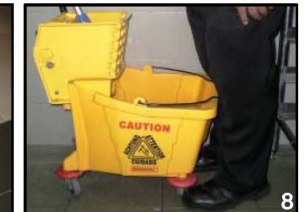
8. Simpan Pel di mop squeezer bila tidak dipakai.