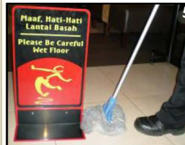
5. Pel Lantai dengan pel yang sudah terendam larutan FORCEMAXX . Pasang WET FLOOR SIGN pada saat pel lantai.