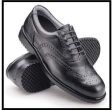
1. Sepatu Kerja – Anti Slip