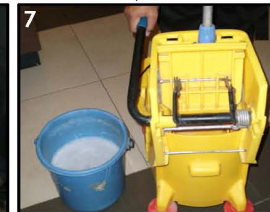
7. Kemudian Peras Pel di mop squeezer. Pel tidak boleh terlalu basah.