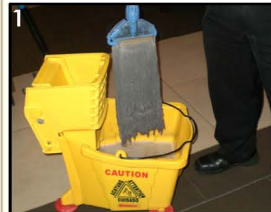
1. Bilas Pel dengan air panas di mop squeezer, naik-turunkan pel 10x.