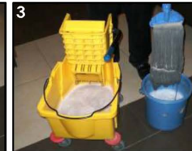
3. Rendam Pel dengan larutan FORCEMAXX dalam ember BIRU. Naik-turunkan pel 5x.