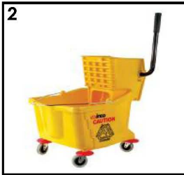
2. Mop Squeezer diisi Air Panas saja, tanpa pembersih