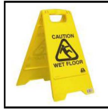
3. Papan Peringatan – LANTAI BASAH