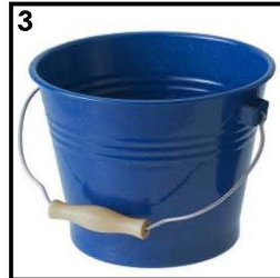
3. Ember Biru untuk Larutan Pembersih FORCEMAXX