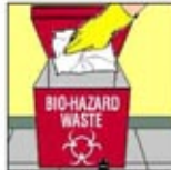
4. Biohazard Waste Container