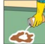
1. Taburkan secara hati-hati bubuk yang cukup supaya menyerap semua cairan dan gas.