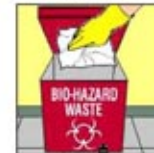
7. Kumpulkan kain lap dan kotoran lalu buang dalam kontainer pembersih biohazard.