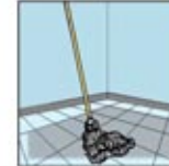
3. Desinfektan area dengan kain pel dan deterjen pembunuh kuman.