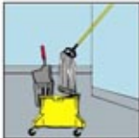
1. Ember dan Kain Pel