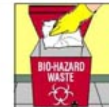
2. Buang sampah yang terkontaminasi dengan tepat.