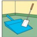
5. Serok dan Alat Pencungkil