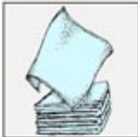
2. Handuk putih dengan daya serap tinggi