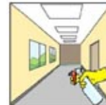
8. Semprotkan kembali dan biarkan kering sendiri.