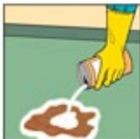
6. Bubuk Penyerap