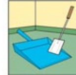
2. Gunakan serok dan pencungkil untuk menyerap bubuk yang terkontaminasi dan buang.