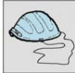
3. Masker Anti Debu