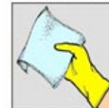
6. Lap area dengan kain pembersih yang dapat dibuang.