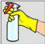
3. Pembersih desinfektan yang sesuai