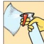
5. Semprot area dengan deterjen dari botol penyemprot.