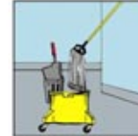
4. Buang air pel ke dalam bak air kotor, lalu gunakan deterjen untuk membersihkan alat.