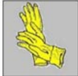
2. Sarung Tangan