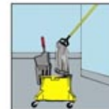
9. Ulangi sekali lagi.