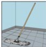
2. Alat Sapu