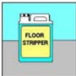
6. Pembersih Lantai