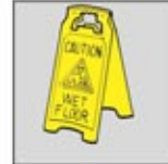
2. Letakkan rambu kerja di tempat yang terlihat.