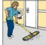
1. Sapu lantai.