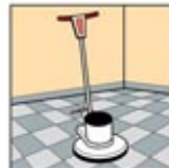
6. Pasang Black Stripping Pad atau Stripping Brush pada mesin pembersih lantai dan lakukan Stripping.