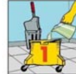
3. Campurkan Floorstrip ke dalam ember berisi air dingin setengah penuh.