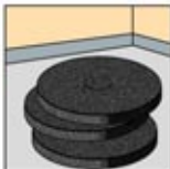
7. Black Stripping Pad atau Stripping Brush