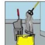
8. Pel kembali lantai dengan air, kain pel dan ember yang bersih.