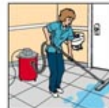
7. Keringkan larutan pembersih dengan Wet dan Dry Vacuum.