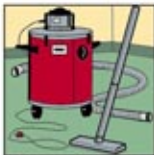
1. Wet dan Dry Vacuum