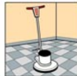
5. Floor Machine