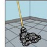
4. Ratakan larutan Floorstrip pada permukaan lantai.