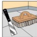
4. Alat Pencungkil dan Sikat Lantai