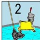
3. Dua Buah Alat Pel dan Ember