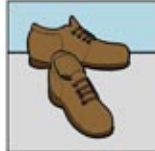
3. Sepatu Kerja