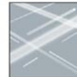
2. Tidak ada cairan yang tertinggal di lantai.