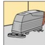
7. Cuci semua peralatan yang sudah dipakai.