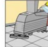
3. Tuang pembersih lantai pada automatic scrubber sesuai instruksi.