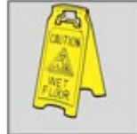
1. Letakkan rambu kerja di tempat yang terlihat.