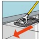
6. Pel ujung dan tepi lantai secara manual. Pel lagi bila larutan berlebihan.