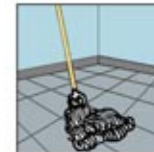
8. Gunakan larutan akhir sesuai label instruksi.