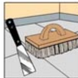
4. Alat Pencungkil dan Sikat Lantai