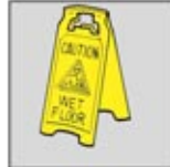
3. Rambu Kerja