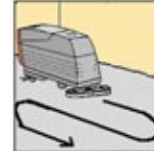
5. Gunakan pembersih, gosok dan angkat dalam sekali pengerjaan.