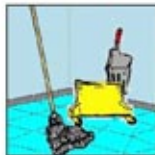
3. Alat Pel dan Ember