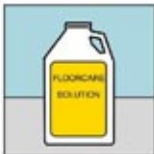
5. Pembersih Lantai

Memeriksa : - Ganti pad yang koyak atau usang. - Pastikan mesin pembersih lantai bekerja dengan baik.