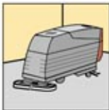
1. Automatic Scrubber