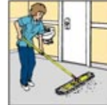
2. Sapu debu.