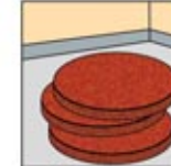
4. Pasang Red Spray Pad atau White Polishing pada Automatic Scrubber.