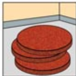
2. Red Spray Pads atau Polishing Brush